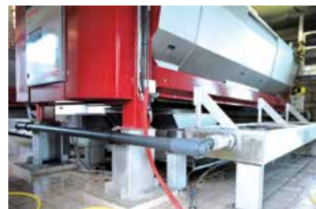
Instalación en otras marcas