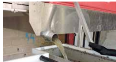
Instalación en "PAI"